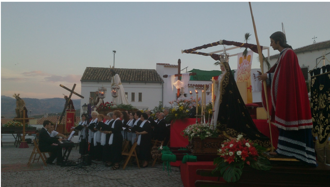
Foto 1.- Bicentenario de la reorganización de la Ilustre Archicofradía de la Vera Cruz y Nuestro Padre Jesús del Prendimiento. Plaza de Palacio, 7 de septiembre de 2013.

Santo en dos filas con sus caras tapadas. En aquella época, los judíos no utilizaban todavía la indumentaria actual, sino que llevaban carátulas.