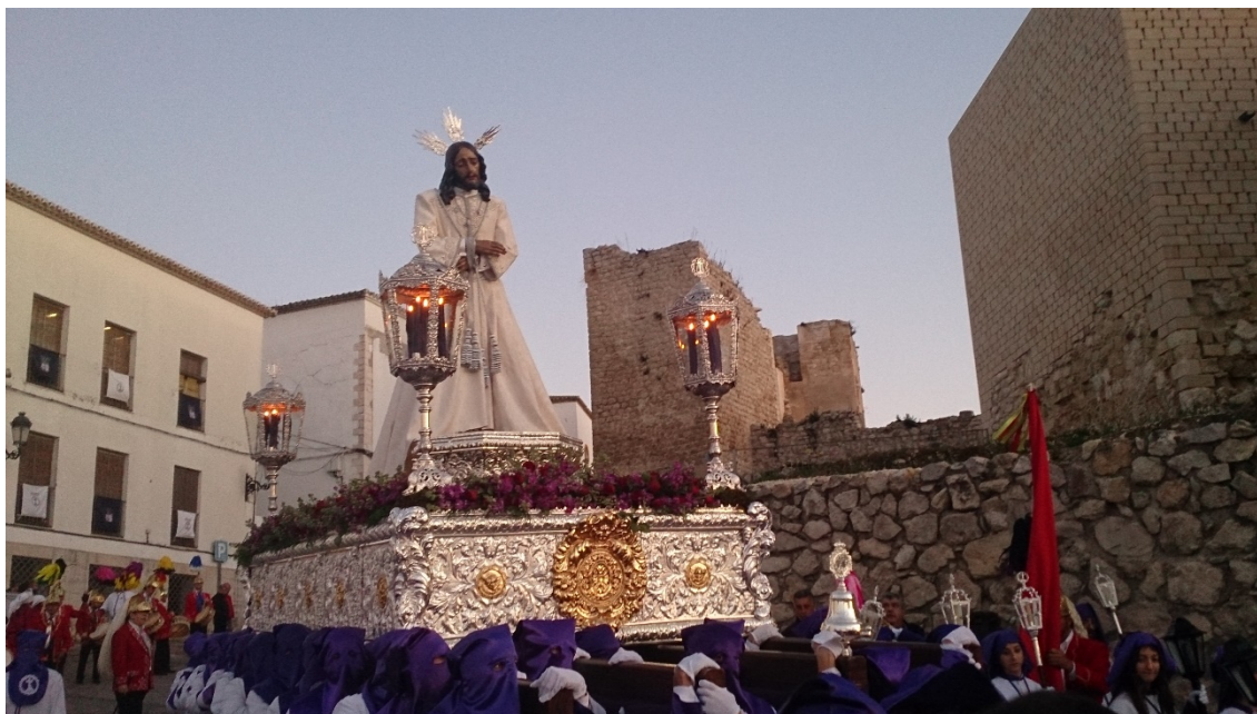
Foto 2.- Nuestro Padre Jesús del Prendimiento. Jueves Santo de 2018.

hecho queda reflejado en el acta del cabildo de la Cofradía de la Vera Cruz celebrado el 25 de marzo de 1866, donde se indica 6 : “... esta asociación... la misma exactamente que la de San Diego, sin otra variación que la del hermano mayor, alférez y mayordomo, y por consiguiente que siendo los cuadrilleros los mismos en ambas procesiones... ”. Esta estrecha relación entre las dos cofradías se volvió a poner de manifiesto en el cabildo de la cofradía de la Vera Cruz celebrado el 5 de abril de 1885, donde se aprobó el siguiente acuerdo 7 : “También a propuesta de varios cuadrilleros se acordó por unanimidad, que al pagar la limosna, presente cada cuadrillero el recibo del Mayordomo del Miercoles Santo, de haber satisfecho su cuota de limosna y de entierros de sus hermanos”.