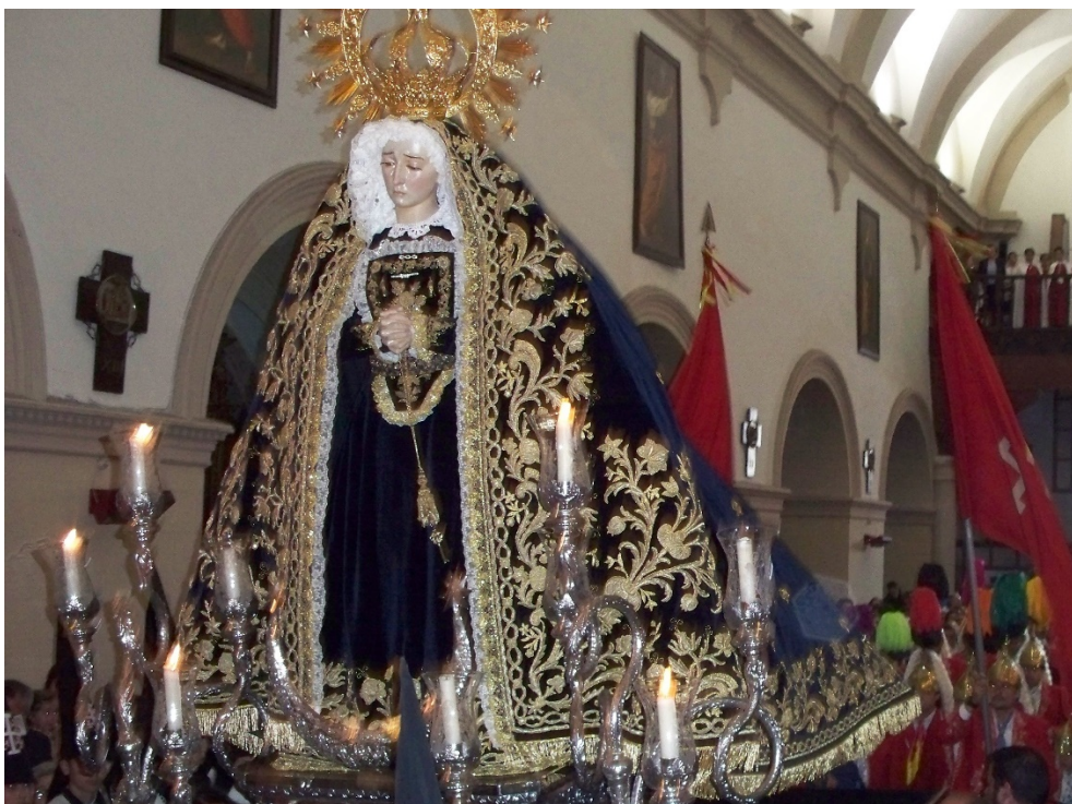
Foto 3.- Entrega de la llave del Sagrario a la Virgen de la Soledad durante los Oficios del Jueves Santo del 21 de abril de 2011 16 . La Turba de Judíos de la Cola Blanca participa desde 1871.