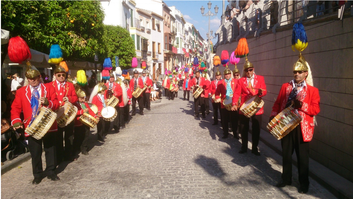
Foto 4.- Visita a los sagrarios. Jueves Santo de 2017.